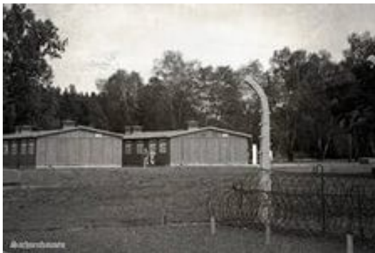
Барак концлагеря в Вюрцбурге

ударов «входных». Боль была страшной. Сухаревич прикладывал невероятные усилия, чтобы не закричать. После этого сверили фамилии и постригли наголо.